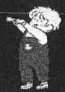
ผู้ที่มีอายุ น้อยกว่า 18 ปี