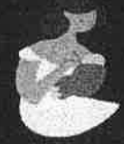
สตรีให้นมบุตร