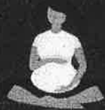
สตรีมีครรภ์