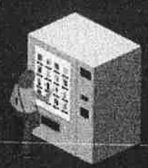
ห้ามขายโดย ใช้เครื่องขาย