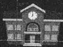
ห้ามขายในสถานศึกษา